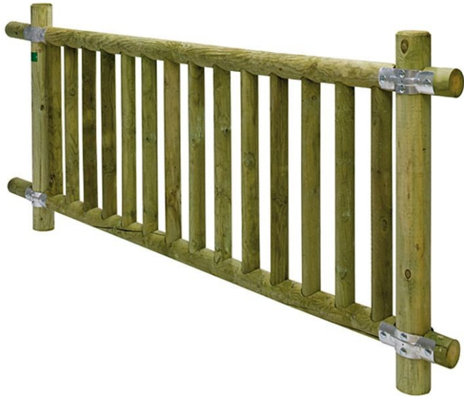
(12) Barana Camí del Convent