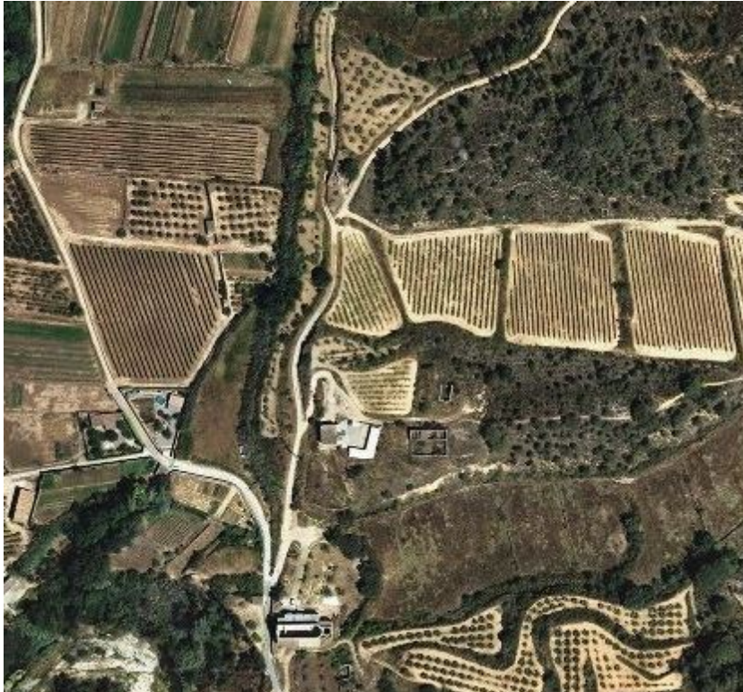
(6) Àrea recreativa polígon industrial