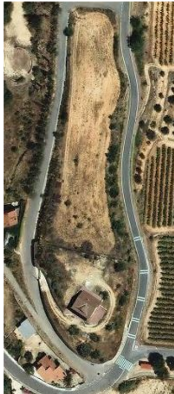
(14) Parc Caní Arbreda